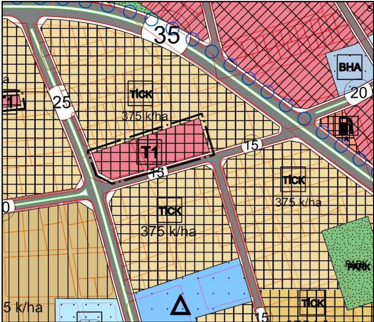
Şekil 2. Yürürlükteki 1/5000 Ölçekli Nazım İmar Planı

Yürürlükte bulunan 1/5000 Ölçekli Nazım İmar Planında davaya konu edilen parsel; Ticaret Alanı(T1) olarak planlanmıştır.