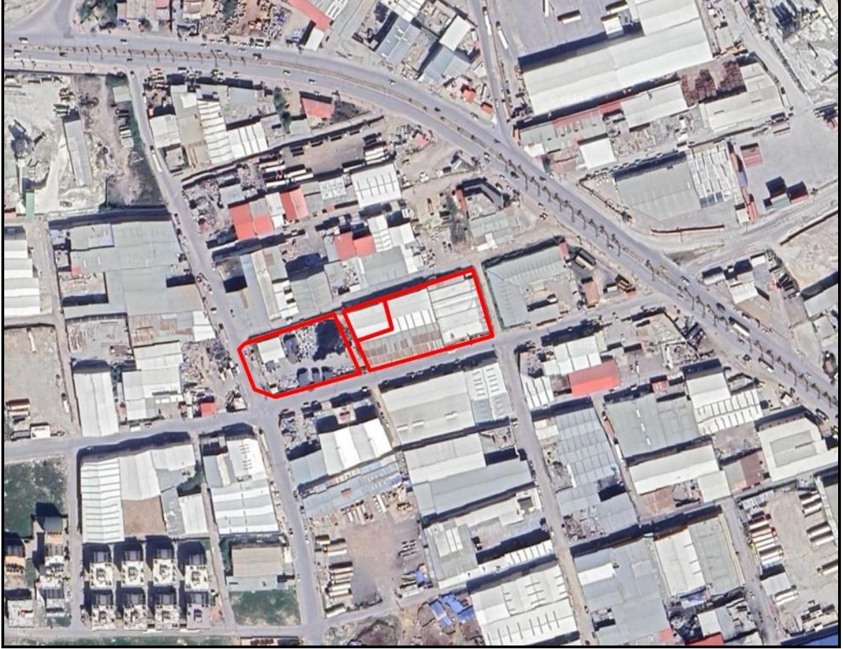
Şekil 1. Planlama Alanının Konumu

İmar planı tadilatına konu edilen alan Toroslar İlçesi Yalınayak Mahallesi'nde Turgut Özal Bulvarı'nın Hal Kavşağı yönünde güneyinde kalmaktadır.