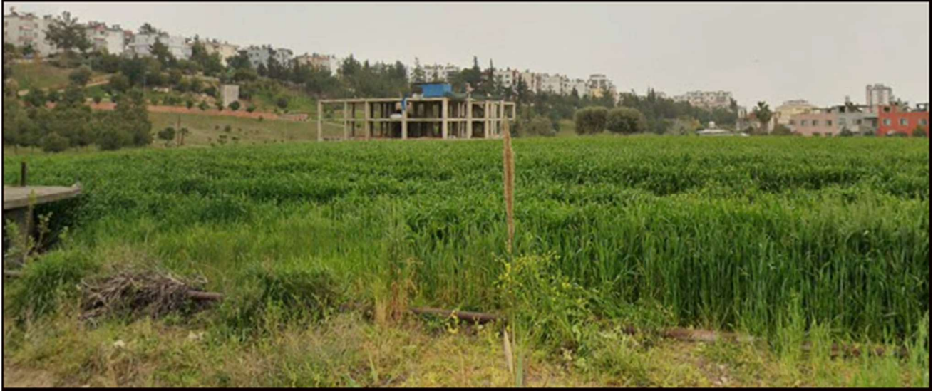
Resim.3 .PLANLAMA ALANININ ÇAVUŞLU MEZARLIĞINDAN GÖRÜNTÜSÜ.