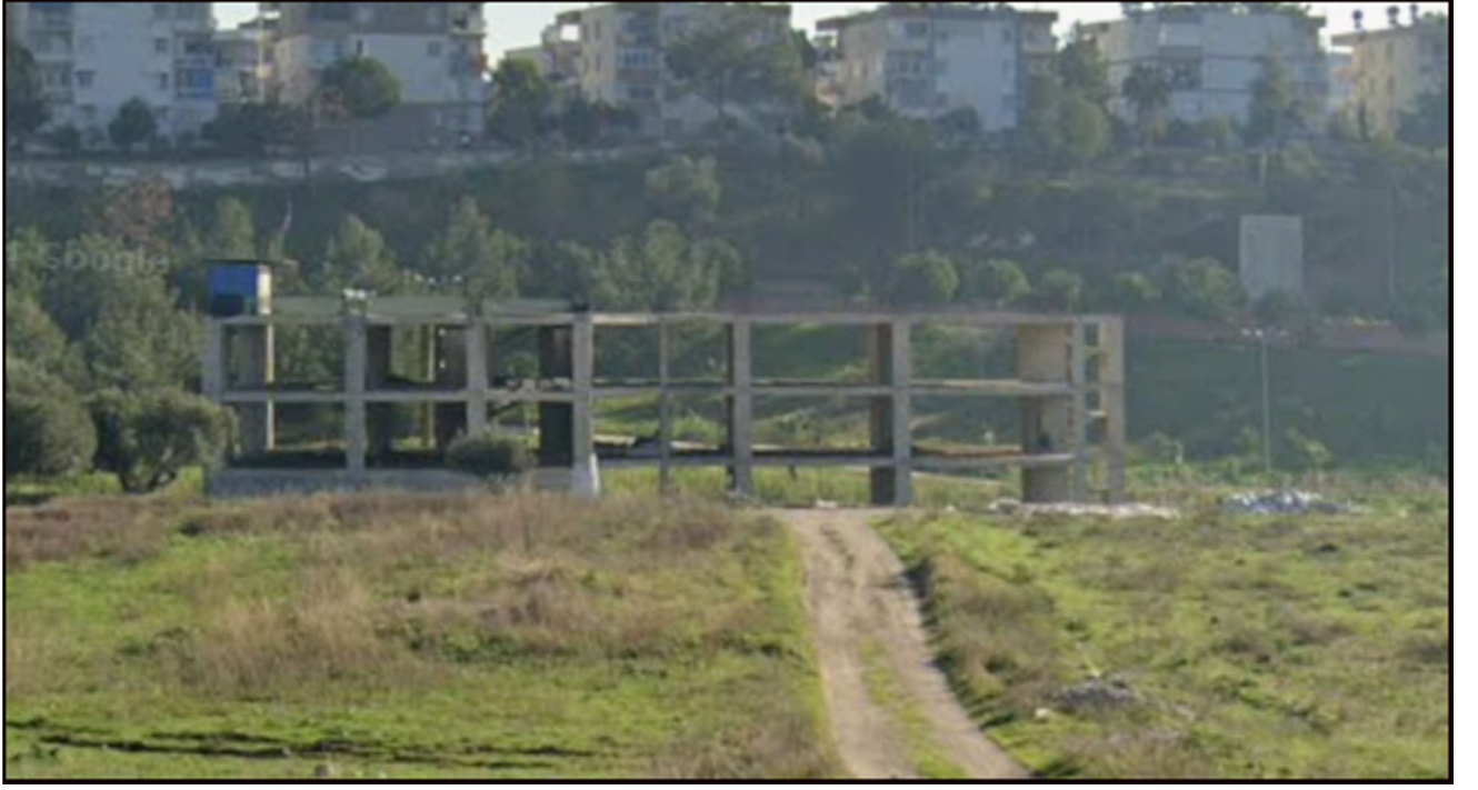
Resim.2.PLANLAMA ALANINDA İNŞAAT HALİNDEKİ YAPININ 207. CADDEDEN ALINAN YAKINDAN GÖRÜNTÜSÜ.