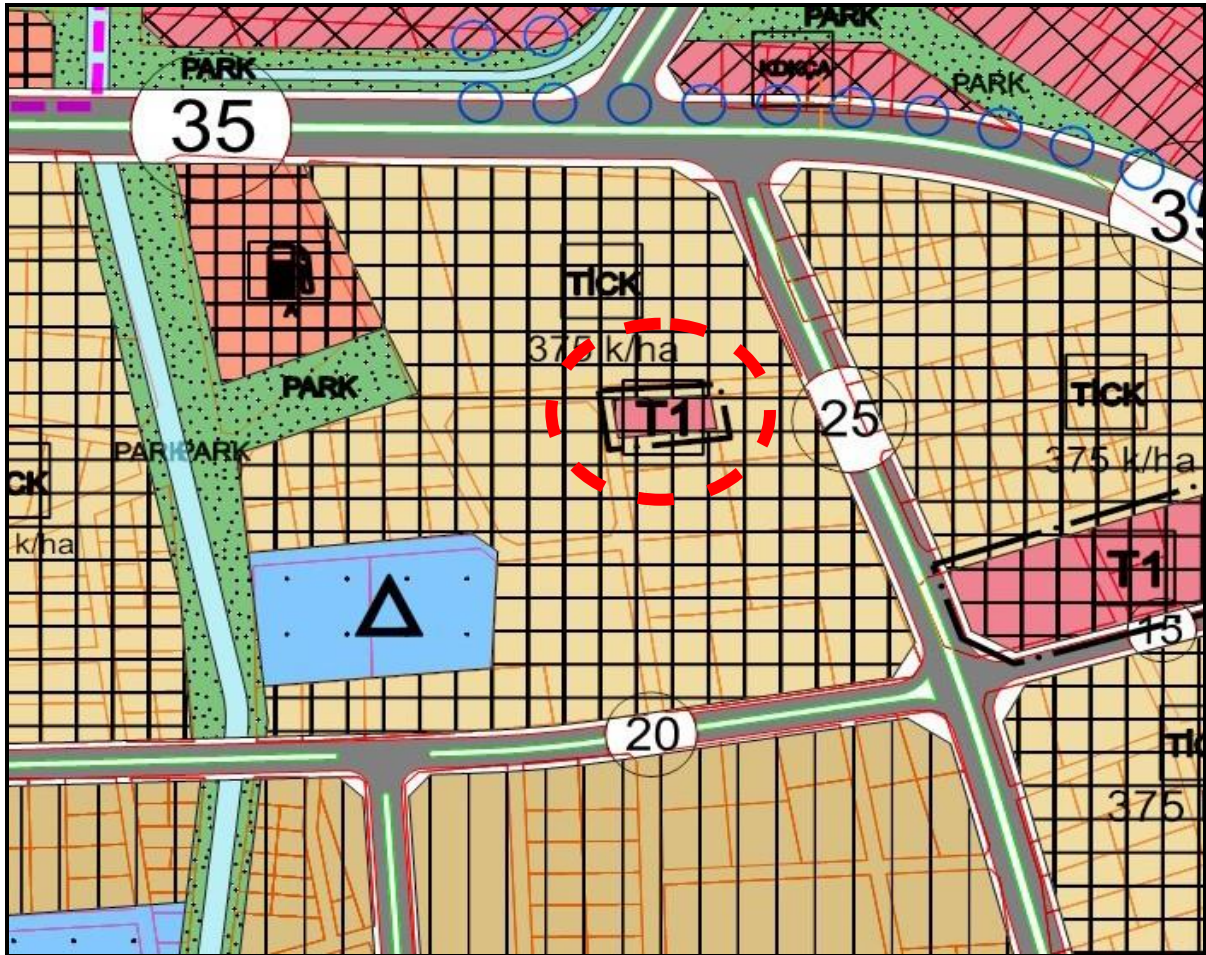
Şekil 2. Yürürlükteki 1/5000 Ölçekli Nazım İmar Planı

Yürürlükte bulunan 1/5000 Ölçekli Nazım İmar Planında davaya konu edilen parsel; Ticaret Alanı(T1) olarak planlanmıştır.