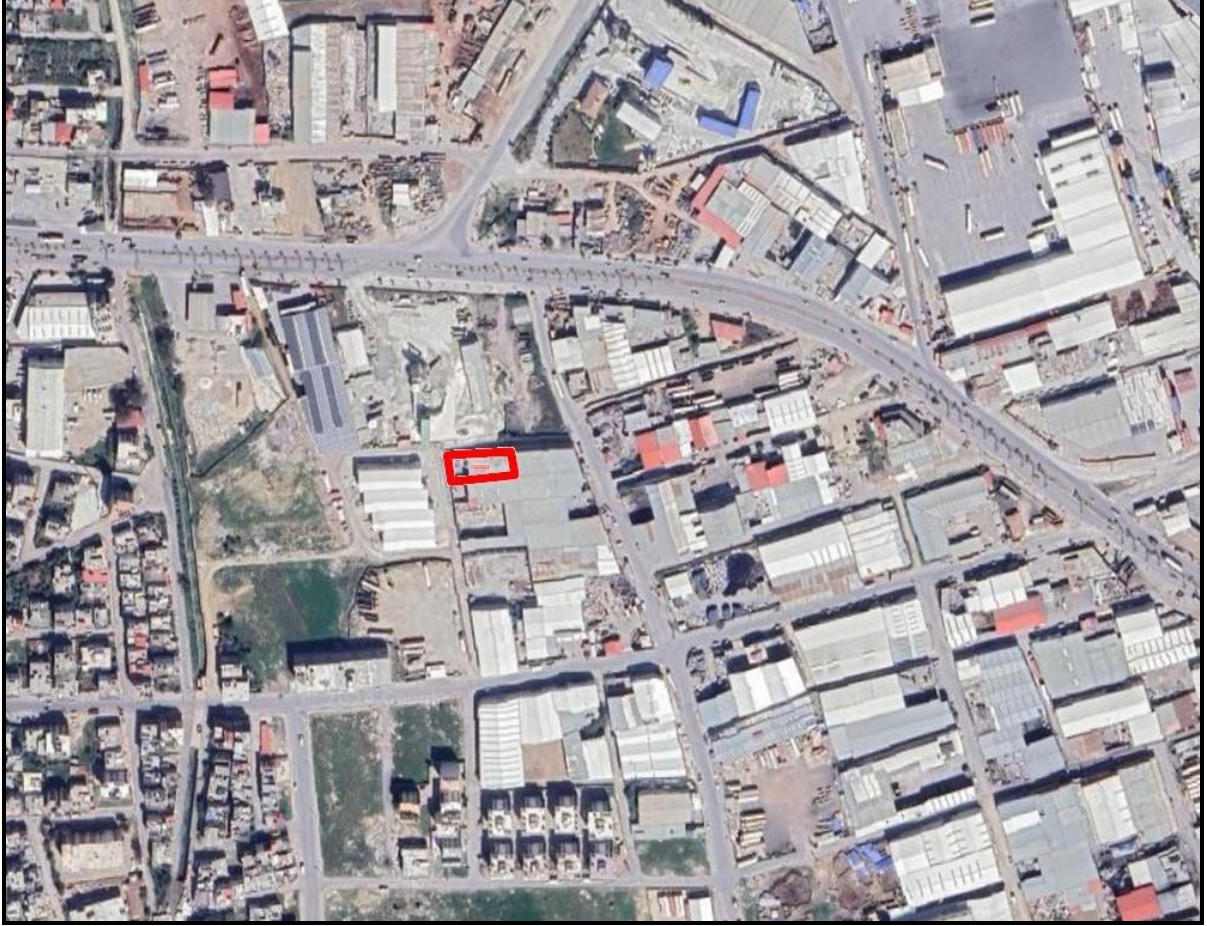
Şekil 1. Planlama Alanının Konumu

İmar planı tadilatına konu edilen alan Toroslar İlçesi Yalınayak Mahallesi'nde Turgut Özal Bulvarı'nın Hal Kavşağı yönünde güneyinde kalmaktadır.