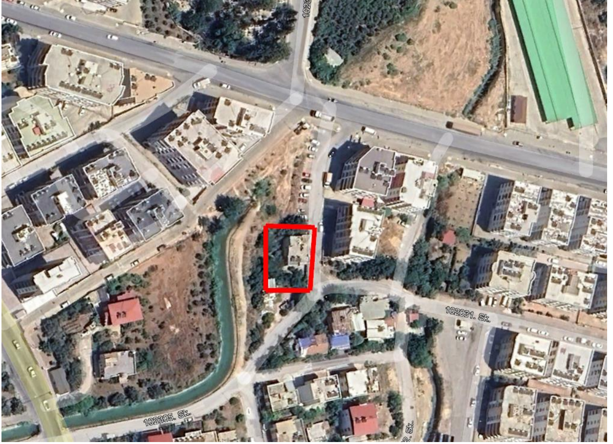
Resim 1. Planlama Alanı Uydu Görüntüsü

Uygulama imar planı değişikliğine konu alanları gösteren uydu görüntüsü aşağıda yer almaktadır.