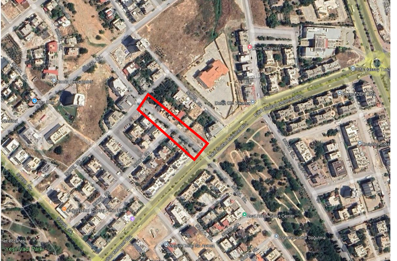
Resim 1. Planlama Alanı Uydu Görüntüsü

Uygulama imar planı değişikliğine konu alanları gösteren uydu görüntüsü aşağıda yer almaktadır.