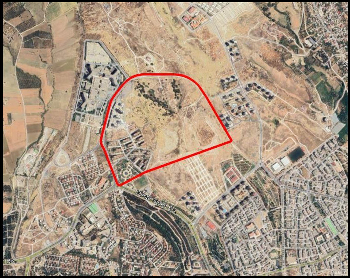
Resim 1. Planlama Alanı Uydu Görüntüsü

Uygulama imar planı değişikliğine konu alanları gösteren uydu görüntüsü aşağıda yer almaktadır.