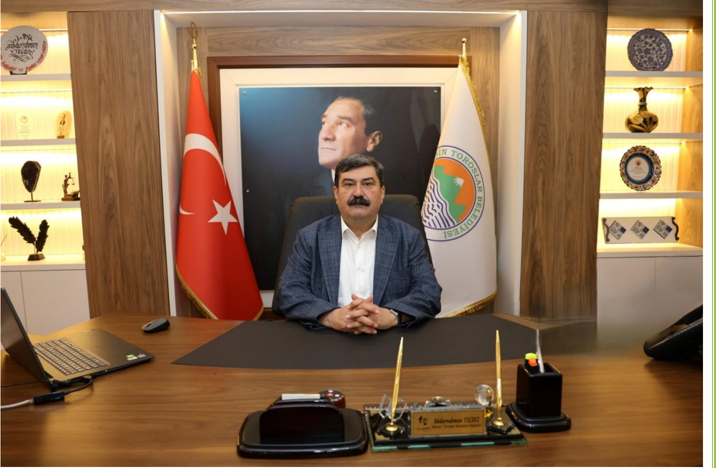
Abdurrahman YILDIZ TOROSLAR BELEDİYE BAŞKANI